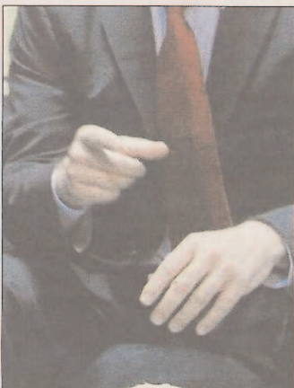
Antich señala a su oponente.

> En la expresión facial, el candidato popular José Ramón Bauzá tampoco ha sabido comunicar con naturalidad, especialmente en la sonrisa, exageradamente forzada y que utilizaba para darle valor añadido al mensaje, aunque no ha convencido porque cuando el cuerpo no secunda lo que se dice, lo que nos llega es la incongruencia.