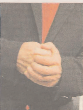
Antich con las manos entrelazadas.

> El candidato popular a la presidencia ha mostrado en todo momento un control postural muy cuidado, ha sabido eliminar barreras y mostrarse relajado. El líder del Partido Popular ha estado muy pendiente de su postura y de sus manos para mostrar seguridad y confianza, aunque su expresión facial no le ha seguido en muchos momentos.