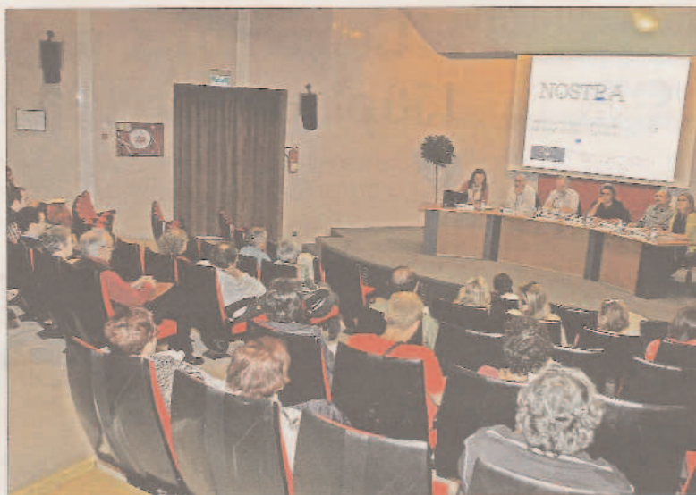
Muchos interesados asistieron a la presentación de la asociación en el Club. (10RPM70)