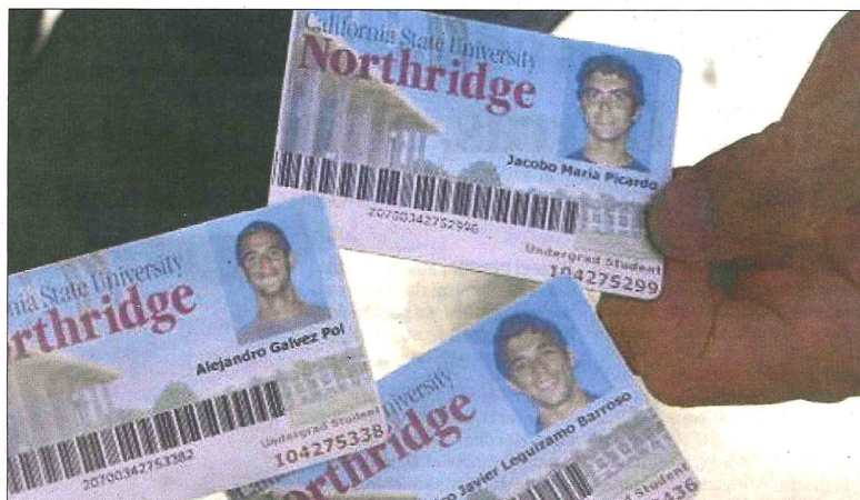
Los carnets de la CSUN de los tres alumnos de la UIB.