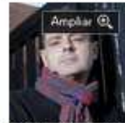
Los psicólogos de Balears ante la crisis

Javier Torres Ailhaud Bajo el epígrafe de crisis se albergan diferentes causas y efectos ampliamente discutidos en los entornos sociales y económicos. En este debate a menudo se mezcla la crítica de la mala gestión de los servicios, con la crítica a todo el sistema en su conjunto. Como resultado, las medidas correctoras que aplican nuestros gobernantes tienen sus peores efectos sobre los tres pilares del sistema de protección social, la salud, la educación y la atención social.