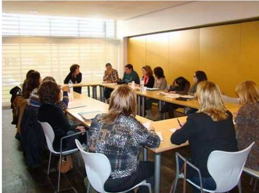
Reunión. Ayer se constituyó la Comisión Mixta en el Consell - CIME

Ayer quedó constituida la Comisión Mixta de Seguimiento dentro del marco del convenio de colaboración firmado entre el Consell y todos los municipios de la Isla. Esta comisión está formada por un responsable político y uno técnico de cada administración, con voz y voto, para favorecer el debate de las líneas de trabajo en red en el ámbito de menores.