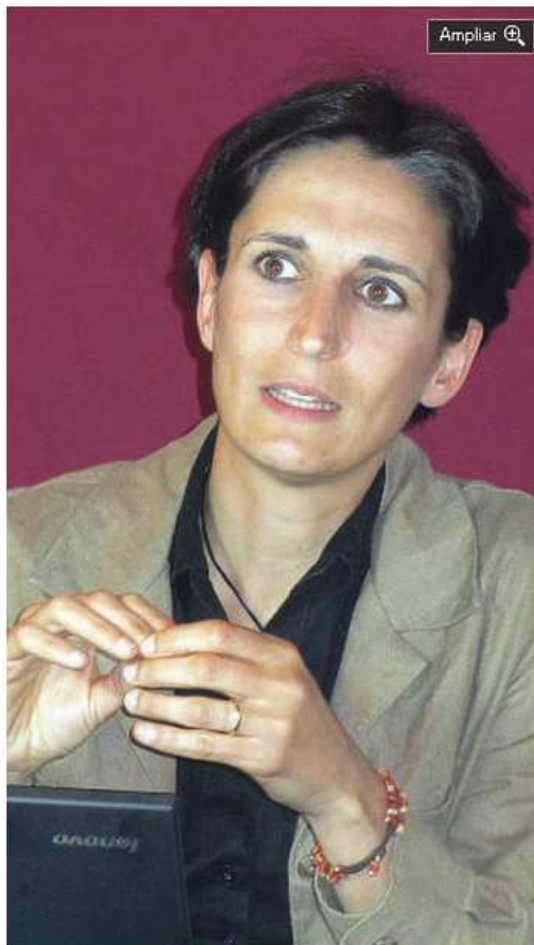
"Con tratamiento estos niños logran grandes cosas".

« Si les afectan tanto los sentimientos de quienes les rodean, supongo que la frustración o la incomprensión de los padres hacia el trastorno es lo primero que hay que trabajar.