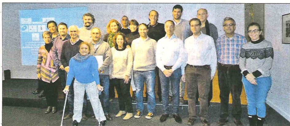
Los participantes en la I Jornada de Comisiones Deontológicas.

Los integrantes de las comisiones deontológicas de colegios profesionales en Ciencias Sociales y de la Salud de Balears se reunieron el pasado lunes para unificar criterios, para compartir objetivos y crear un espacio común entre todos.