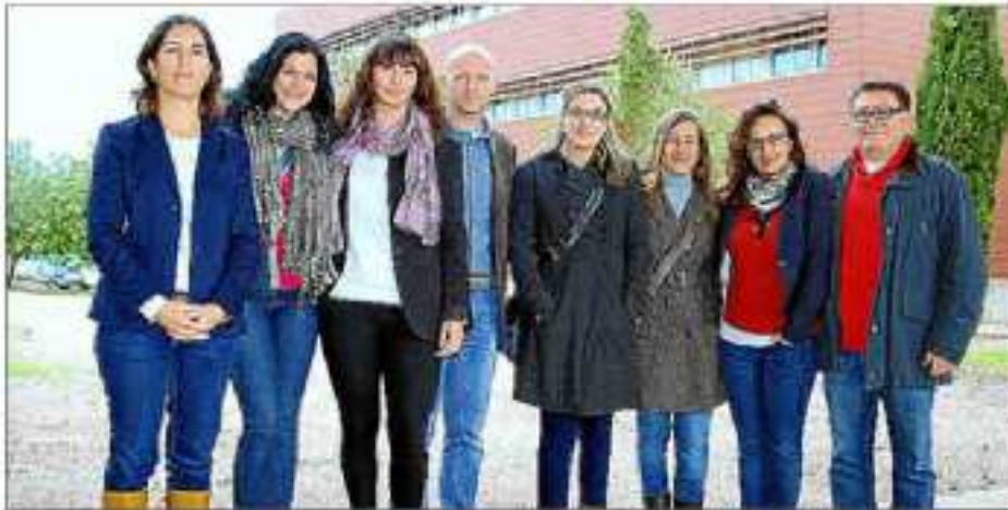
Miembros del equipo que ha realizado esta investigación.