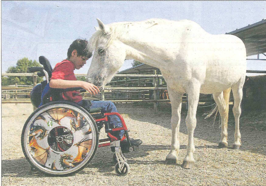
Les teràpies amb animals ja són d'ús habitual en altres països. S'HORT VELL