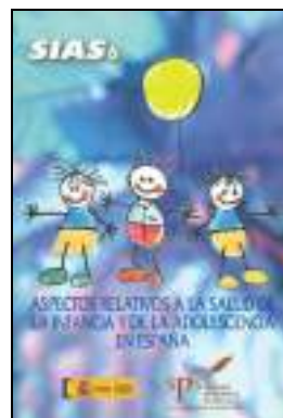
CLÍNICA 901 ASPECTOS RELATIVOS A LA SALUD DE LA INFANCIA Y DE LA ADOLESCENCIA EN ESPAÑA. Edita: Sociedad de Pediatría Social