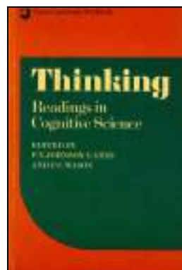
GENERAL 454 THINKING. Johnson P.N.; Wason P.C. (Ed.) Edita: Cambridge University Press