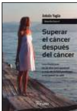
CLÍNICA 899 SUPERAR EL CÁNCER DESPUÉS DEL CÁNCER. Yagüe, Antolín Edita: Vitruvio