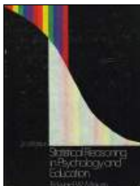
EDUCATIVA 489 STATISTICAL REASONING IN PSYCHOLOGY AND EDUCATION. Minium, Edward W. Edita: John Wiley & Sons