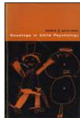
EDUCATIVA 488 READINGS IN CHILD PSYCHOLOGY. Dennis, Wayne Edita: Prentice-Hall