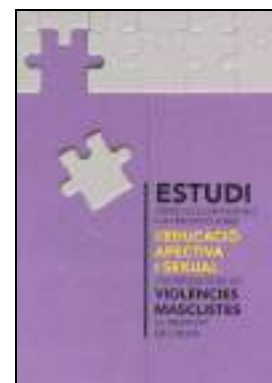
GÈNERE 18 ESTUDI SOBRE ELS CONEIXEMENTS I LA PERCEPCIÓ SOBRE L'EDUCACIÓ AFECTIVA I DE PREVENCIÓ DE LES VIOLÈNCIES MASCLISTES. Edita: Ajuntament de Calvià