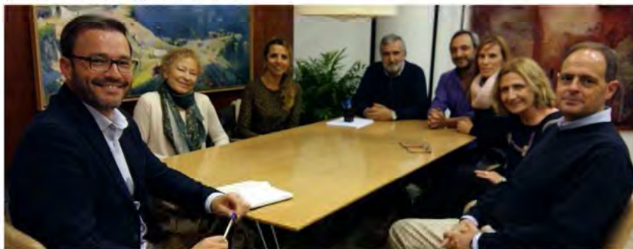
Momento de la reunión entre la junta del COP Islas Baleares y el alcalde de Palma

Durante la reunión, que transcurrió en un ambiente de total cordialidad, se abordaron distintos asuntos en los que la intervención del profesional de la psicología resulta fundamental para mejorar la calidad de vida de los ciudadanos de Palma. Los responsables del COP Islas Baleares expusieron al alcalde su preocupación por los sectores más vulnerables de la sociedad y expresaron el interés del colectivo profesional por tener una participación más activa y aportar sus conocimientos y experiencia en el desarrollo y elaboración de programas orientados a mejorar la atención de los colectivos relacionados: tercera edad, víctimas de violencia machista, menores, LGTB. En esa línea, los miembros del COP Islas Baleares expresaron su disposición por colaborar con los servicios del Ayuntamiento en programas de interés común.