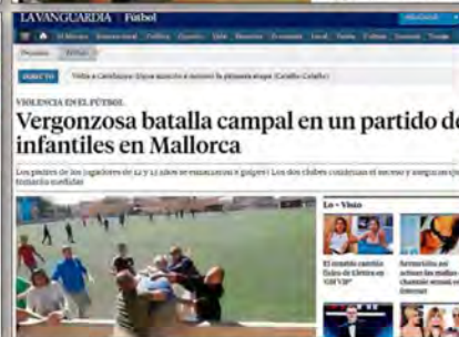
Los portales digitales de diferentes periódicos, tanto nacionales como internacionales, como el Daily Mail británico, que abrieron con el suceso de Alaró.