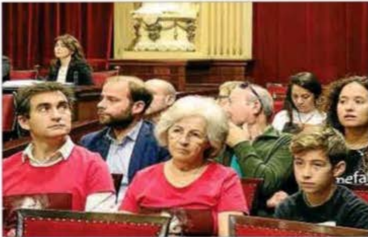
Familiares y amigos de personas desaparecidas.