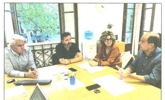
Reunión con El PI.

Durante el mes de noviembre, la delegación del COPIB ha mantenido encuentros con El PI-Proposta per les Illes, Ciudadanos y Unidas Podemos. Todos ellos han valorado