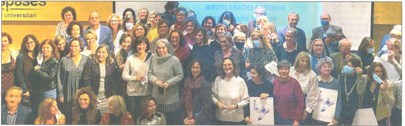
Foto familia colegiados y colegiadas homenajeados.