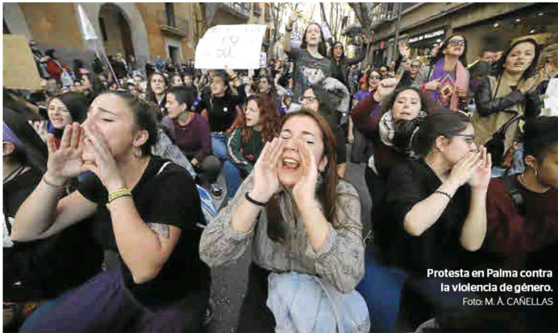
Protesta en Palma contra la violencia de género.