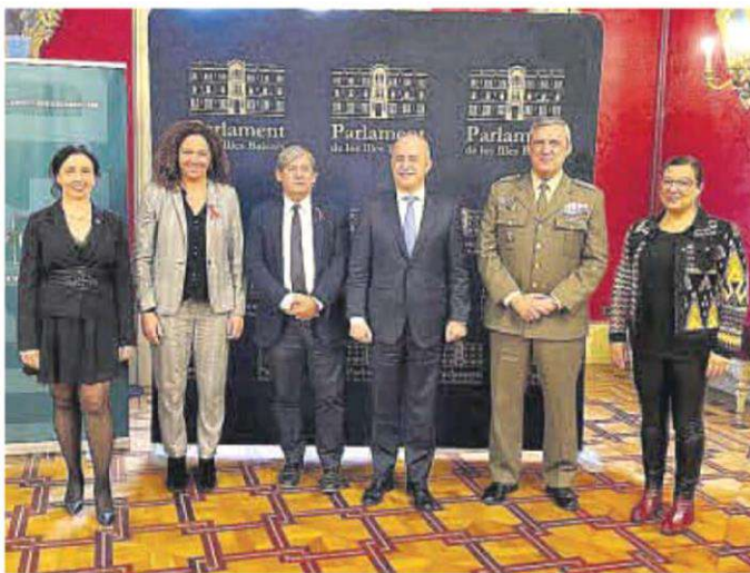
La directora y el rector de la UNED con las autoridades locales.

«El suicidio es la primera causa de muerte entre los menores de treinta años», explicó el rector de la UNED, que aprovechó para anunciar la creación de la cátedra ayer en el 45º aniversario de la