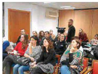
Momento de la presentación del estudio.

El estudio sobre la prostitución en Manacor concluye con cinco líneas básicas de actuación en las que destacan la prevención y la protección, pero, además, también habla de desarrollar sistemas de escucha para las mujeres que ejercen la prostitución, persecución del proxenetismo o del tráfico de mujeres y la trata, y la promoción para ayudar a la inserción laboral y luchar contra la pobreza.