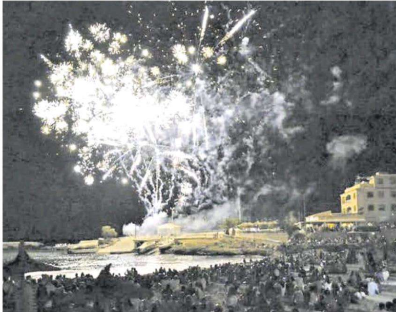
Manacor puso coto en 2019 a los fuegos artificiales en Nochevieja, Reyes y Sant Antoni.

Las propuestas enviadas han sido elaboradas por el Grupo de Especialistas en Medicina del Comportamiento Animal (ETO-COVIB) y cuentan con el visto bue-