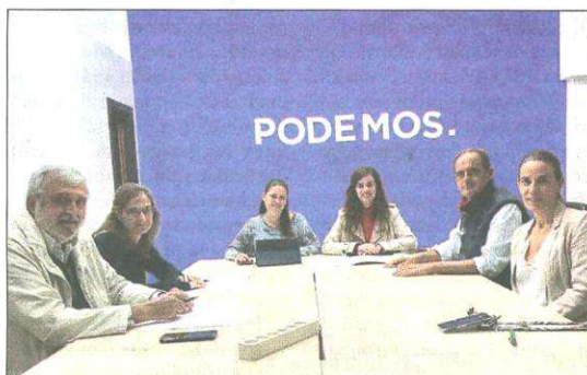
Reunión con Podemos.

El objetivo de los encuentros, celebrados a petición del Colegio, era trasladar un documento elaborado por la Junta de Gobierno del Colegio con 20 propuestas destinadas a promover y mejorar el bienestar psicológico y emocional de la ciudadanía en cuatro ámbitos específicos de actuación (so-