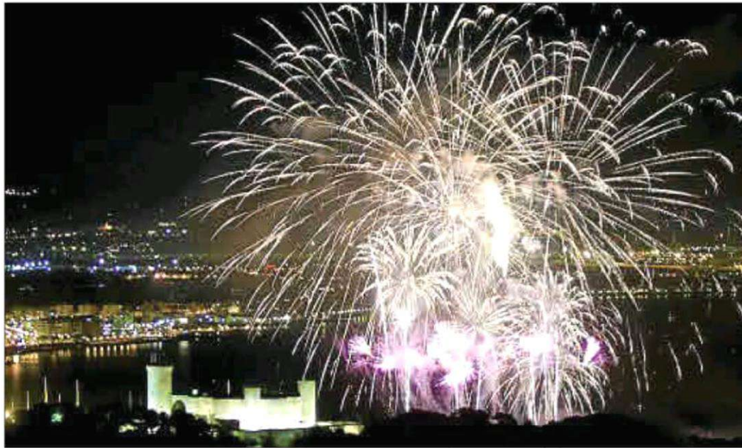
Momento pirotécnico en la bahía de Palma.