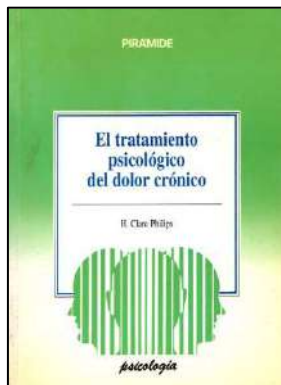
CLÍNICA 991 EL TRATAMIENTO PSICOLÓGICO DEL DOLOR CRÓNICO. Philips, H. Clare Edita: Pirámide