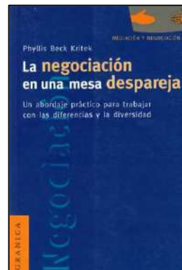
TERAPIA FAMILIAR 98 LA NEGOCIACIÓN EN UNA MESA DESPAREJA. Beck Kritek, Phyllis Edita: Granica