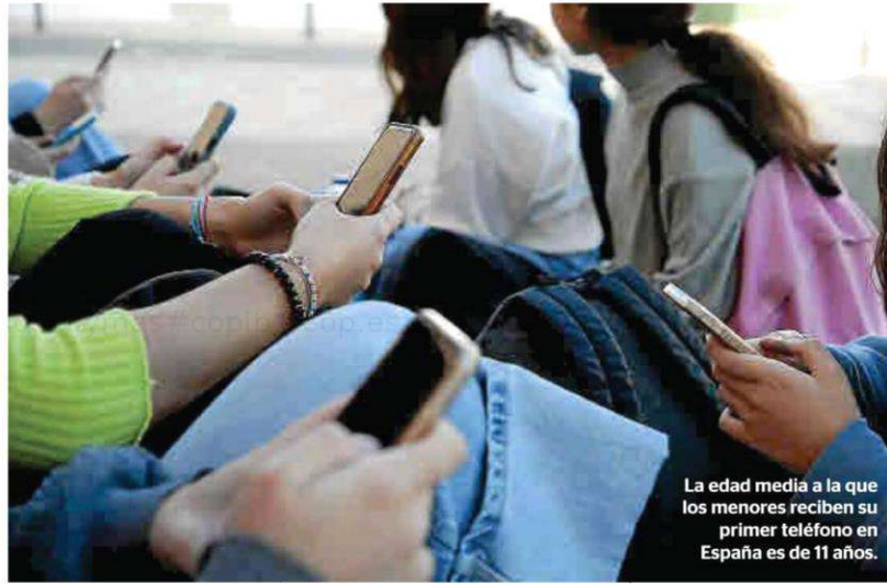
La edad media a la que los menores reciben su primer teléfono en España es de 11 años.

En el caso de que los agentes comprueben que el acoso se produce entre dos alumnos de una