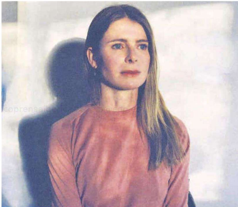
La escritora norteamericana Emma Cline.

— Alex se gana la vida obteniendo cosas de los hombres, pero todos los que se encuentra en su viaje siempre quieren algo de ella, también.