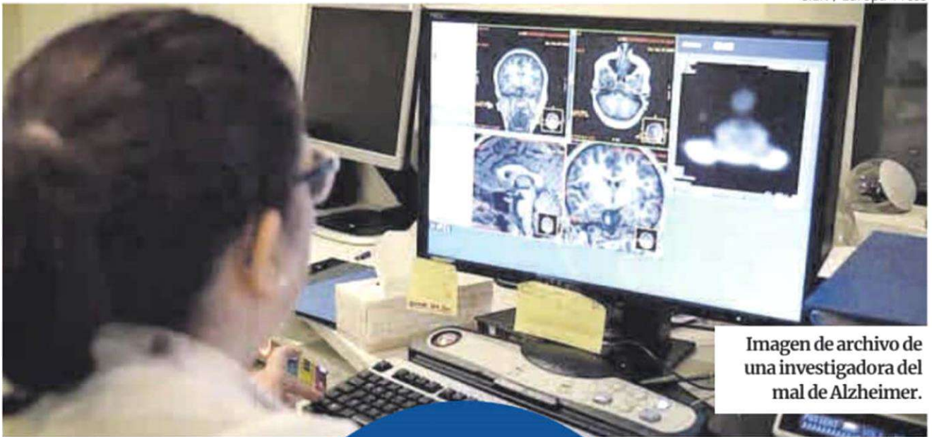
Imagen de archivo de una investigadora del mal de Alzheimer.