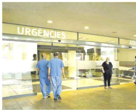
Imagen de archivo de dos enfermeros en las urgencias de Son Espases.

Como parte de la población general, las enfermeras son susceptibles de sufrir problemas de salud mental y/o adicciones al alcohol u otras drogas a lo largo