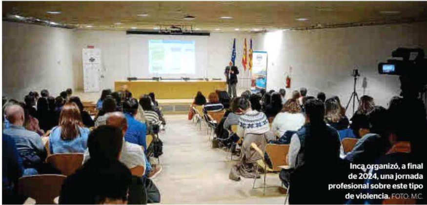
Inca organizó, a final de 2024, una jornada profesional sobre este tipo de violencia.