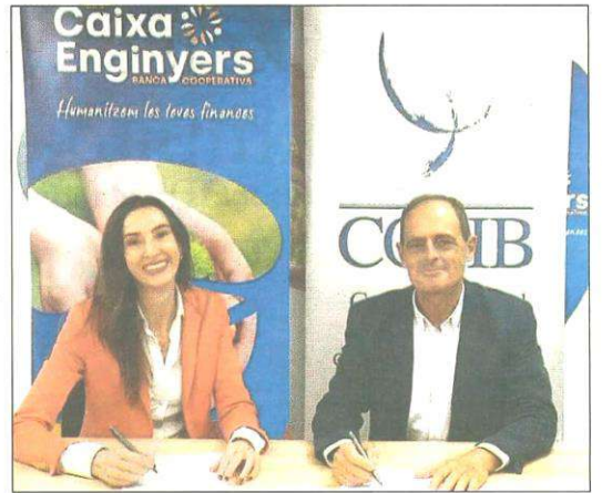
Momento de la firma del acuerdo.

Caixa Enginyers es una sociedad cooperativa de crédito que ofrece servicios financieros y aseguradores con un enfoque social y cooperativo. Su misión es acompañar a sus socios en sus proyectos personales y profesionales, apostando por un modelo sostenible y solidario.