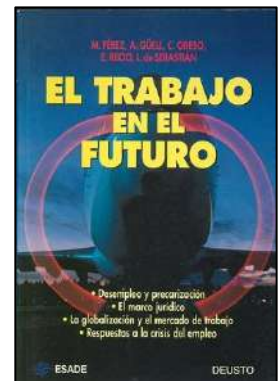
SOCIAL 425 EL TRABAJO EN EL FUTURO Diversos autores/ autores Edita: Deusto

GENERAL 567 25 AÑOS DANDO VOCES Ferrer, Amparo Edita: Feaps