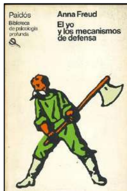
PSICOANÁLISIS 280 EL YO Y LOS MECANISMOS DE DEFENSA Freud, Anna Edita: Paidós