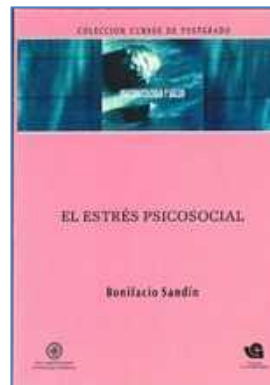
CLÍNICA 1171 EL ESTRÉS PSICOSOCIAL Sandín, Bonifacio Edita: UNED (Fundación Universidad-Empresa)