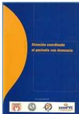
CLÍNICA 1170 ATENCIÓN COORDINADA AL PACIENTE CON DEMENCIA Diversos autores/ autores Edita: Doyma