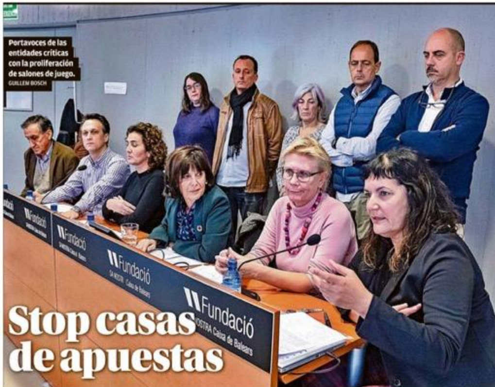
Portavoces de las entidades críticas con la proliferación de salones de juego. GUILLEM BOSCH

► LOS AGENTES SE ALIARON CON EL EMPRESARIO PARA HUNDIR A LA COMPETENCIA ► LES ACUSA DE CREAR UNA GRAN TRAMA CORRUPTA 6