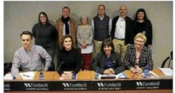
Trece entidades. Ayer hubo representación de FAPA Mallorca, Unicef, Defensora de la Ciudadanía, Juguesca, Projecte Home, colegios de Psicología, Pedagogía, Trabajo Social y de Educadores Sociales, la Federación de AAVV, IREFREA y la Oficina Balear de la Infancia.