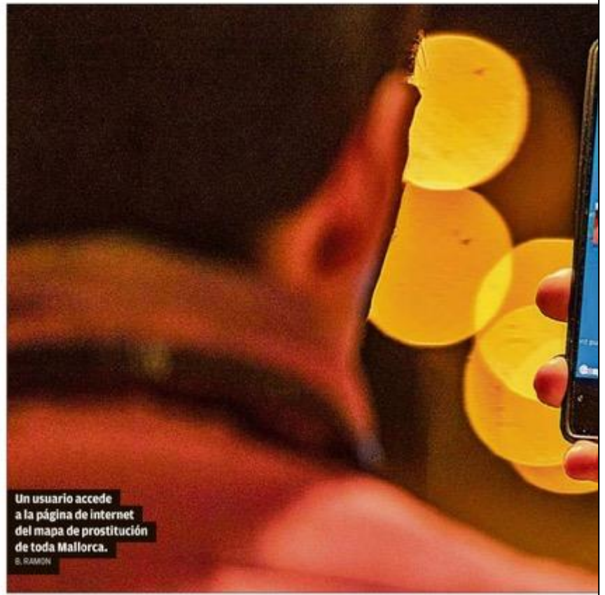
Un usuario accede a la página de internet del mapa de prostitución de toda Mallorca.