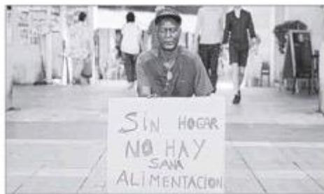
Imagen de archivo de un acto de visibilidad.

► En el Día Europeo de los Sin Techo , la asociación solicita a las administraciones programas de vivienda compartida