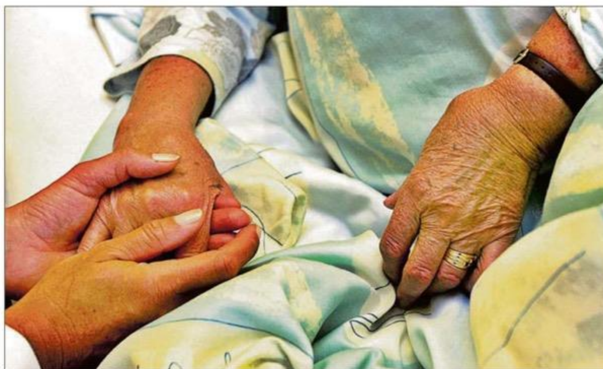
La iniciativa recuerda que hay personas con diagnóstico irreversible que piden una muerte digna.