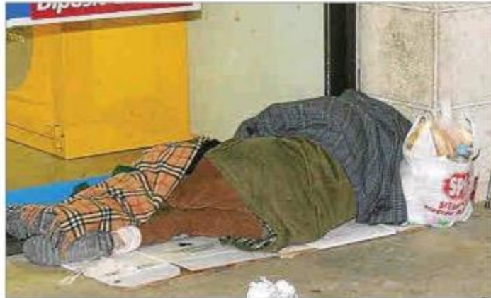
Muchos prefieren dormir ahí, cubiertos con una manta, que hacerlo en los albergues.

Ayer por la mañana nos dimos una vuelta por el comedor social Tardor, donde las cosas siguen igual; es decir, llegando más gente cada día, gente, sobre todo, de Colombia y Venezuela, que llegan o bien huyendo de los narcotraficantes, o bien huyendo de la hambruna y de que en el país no se puede aguantar más. Gente que llega, además, con hijos menores de edad, que de no tener un techo bajo el que cobijarse –todos llegan con lo puesto– intervendrán los servicios sociales y los internarán en un centro de acogida. Sus padres seguramente irán a parar otro, y tienen que encontrar trabajo, que sin papeles no es sencillo. Es decir, que a la tragedia que les obliga a abandonar su país, deben ahora sumar la de la supervivencia.