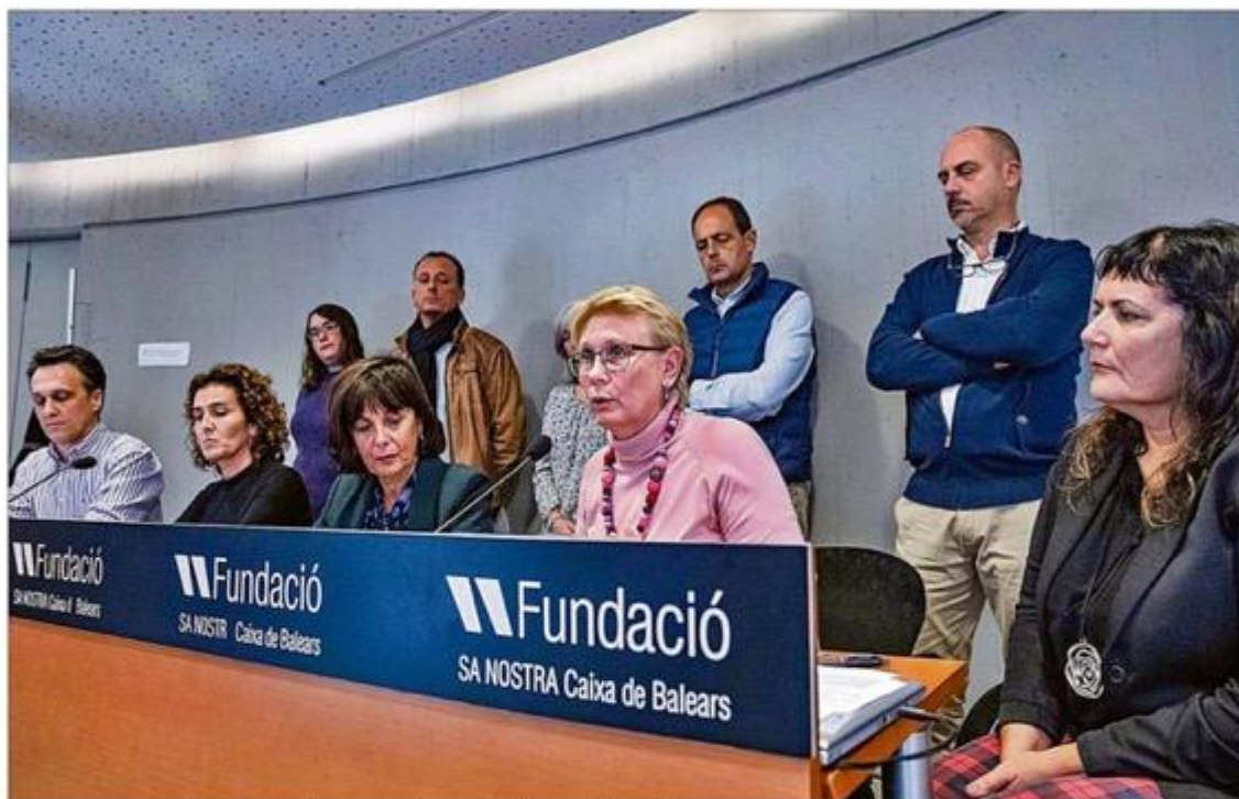
Los representantes de estas asociaciones secundaron el manifiesto de denuncia.

Todas estas entidades manifestaron ayer su rechazo al "incremento descontrolado" de las casas de apuestas que se extienden por las barriadas y por los pueblos de Mallorca. Además de estas salas hay que añadir las máquinas tragaperras (4.216) que hay repar-