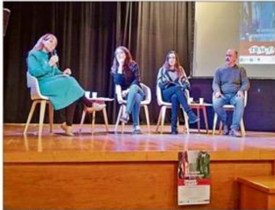
Mesa redonda sobre prostitución ayer en Calvià. B. P.

Ortega expuso ayer el Plan de lucha contra el tráfico de mujeres y niñas con fines de explotación sexual y abordaje de la prostitución durante las III Jornadas sobre prostitución y trata organizadas por el ayuntamiento de Calvià. Se trata de un plan orientado a promover y proteger los derechos humanos desde una perspectiva de género y se dirige a toda la sociedad de Balears, en especial, a los hombres, los prostituidores,