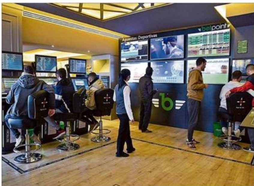
Las casas de apuestas se reparten por todas las barriadas de la ciudad.

Sin embargo, en lo que no tiene ninguna competencia el Govern balear es en el negocio del juego online. Se trata de un sector que debería ser regulado por el Esta-