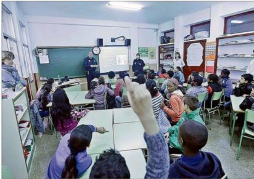
Imagen de una jornada sobre 'bullying' en un colegio de Balears.

Los NESE (alumnos con necesidades específicas de apoyo educativo) están a la cabeza de los "colectivos diana" para sufrir acoso escolar. Ellos aparecen como víctimas en 95 de los 407 protocolos abiertos (el 23,3% del total). A su vez, 129 alumnos NESE fueron ofensores, lo que supone el 31,6%