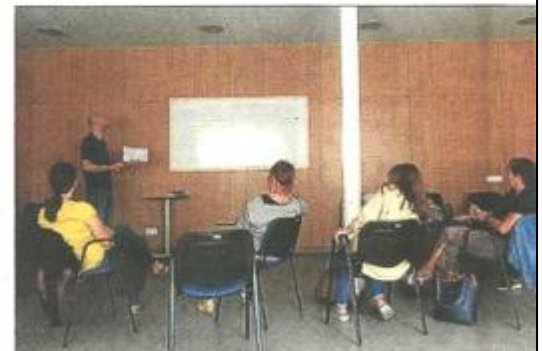
Responsables de equipo del programa de autocuidado, salidas al campo y charlas organizadas para evitar el desgaste.

Paralelamente, la demanda de profesionales sanitarios con problemas psicológicos o adicciones ha aumentado exponencialmente. En el binomio 2017-2018 fueron atendidos 877, un 30 % más que en los dos