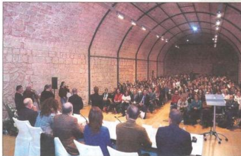
Numeroso público asistió.