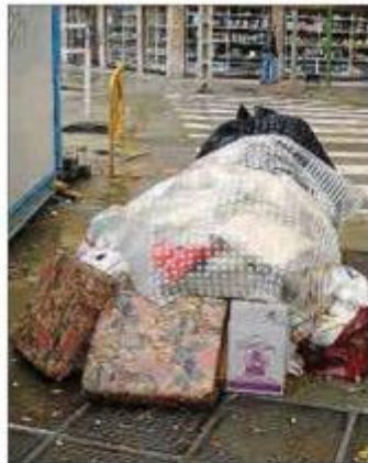
Cada vez hay más gente en la calle

El recién creado grupo Callejeros de Tardor se compromete a contarlos