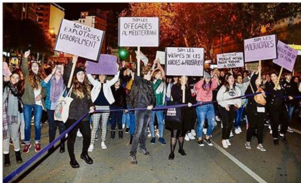
Manifestación feminista en Palma con motivo del Día contra la Violencia de Género. GUILLEM BOSCH

► Un 20 por ciento de las mujeres de Balears se encuentra en riesgo de exclusión social por la desigualdad cultural, económica y social