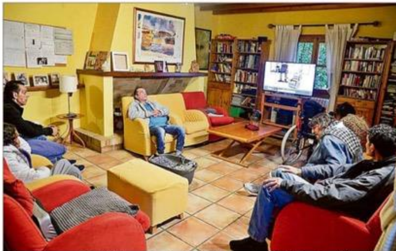
Algunos de los usuarios de Siloé, ayer en la sala de estar de la casa de acogida de Santa Eugènia. GUILLEM BOSCH

Todos los usuarios de Siloé son derivados a estas dos casas por el Institut Mallorquí de Afers Socials (IMAS) siempre y cuando cumplan estos dos requisitos: tener re-