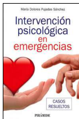
EMERGENCIAS 23 INTERVENCIÓN PSICOLÓGICA EN EMERGENCIAS. Pujadas Sánchez, María Dolores Edita: Pirámide