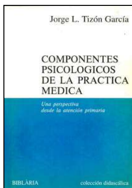
CLÍNICA 917 COMPONENTES PSICOLÓGICOS DE LA PRÁCTICA MÉDICA. Tizón García, Jorge L. Edita: Biblaria